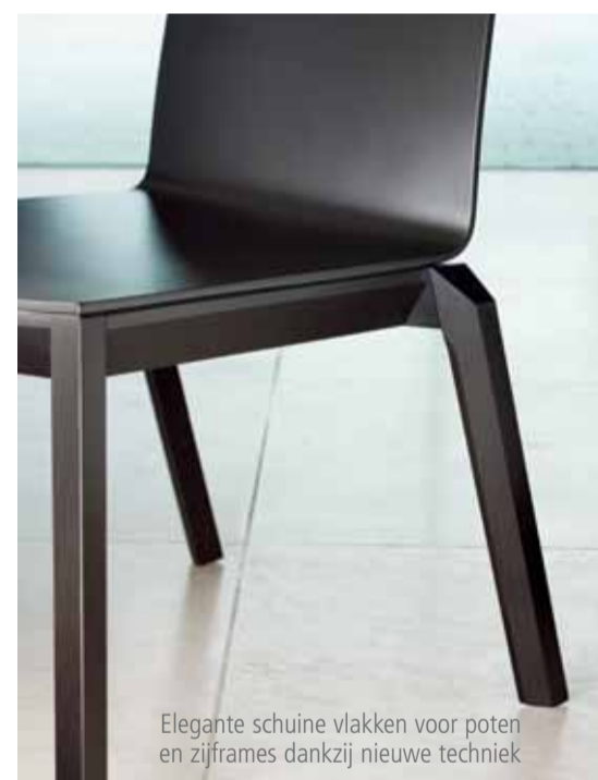
Elegante schuine vlakken voor poten en zijframes dankzij nieuwe techniek