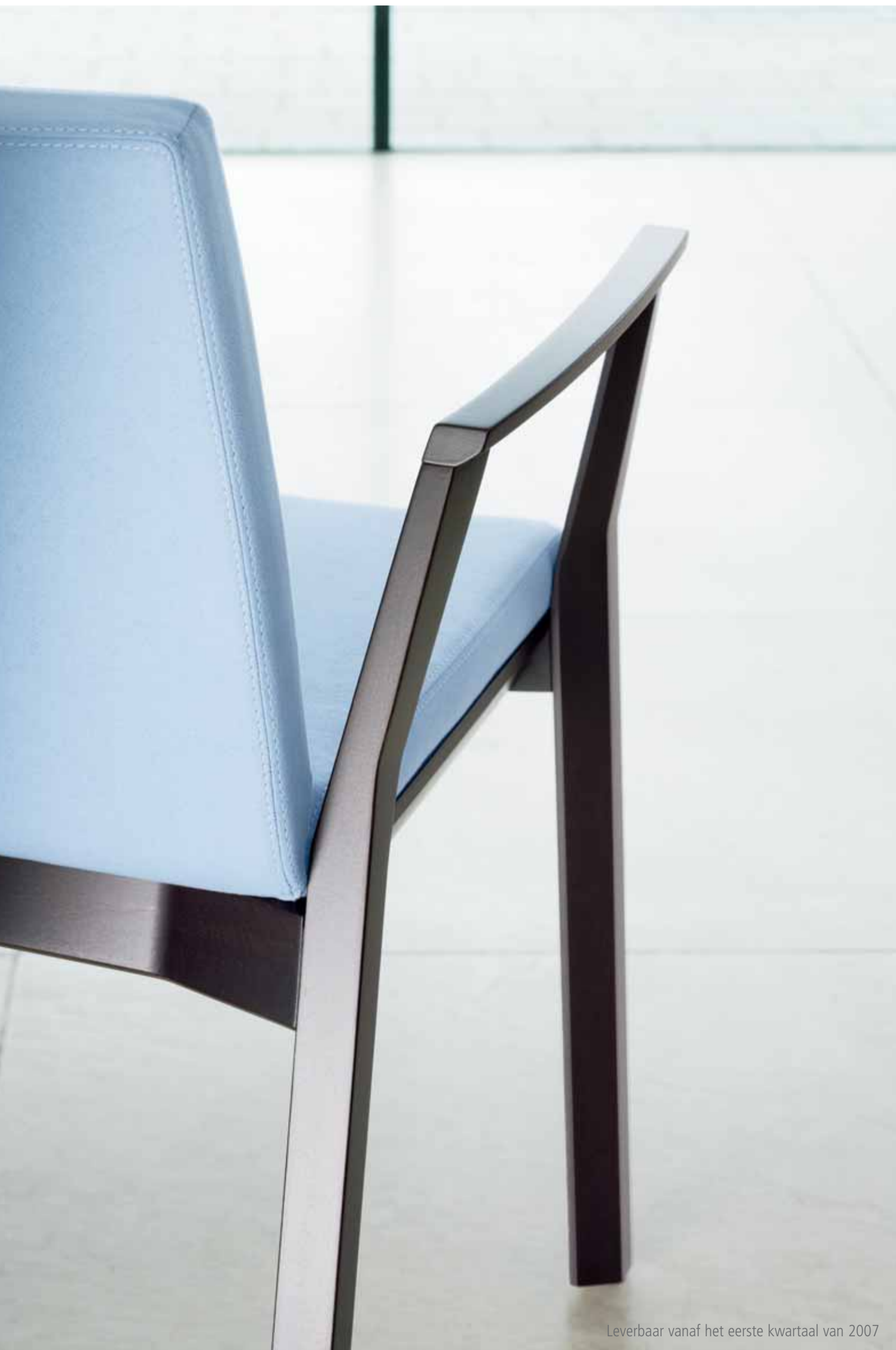
Leverbaar vanaf het eerste kwartaal van 2007

EVA Chair – Art Center College of Design Pasadena, California