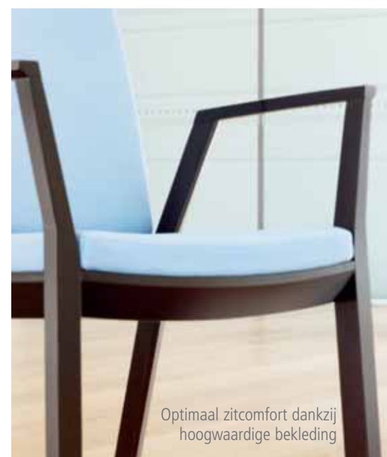
Optimaal zitcomfort dankzij hoogwaardige bekleding