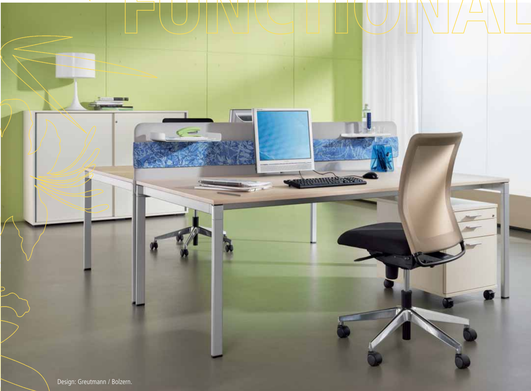
Design: Greutmann / Bolzern.

Wat van een werkplek wordt verlangd, hangt af van de taken die er moeten worden uitgevoerd. veron is erop gericht plaats te bieden aan een breed scala van activiteiten. Afhankelijk van • de beschikbare informatie- en communicatietechnologie binnen een bedrijf; • de mate waarin hardware wordt ingezet en bekabeling nodig is; • de taken van de afzonderlijke medewerkers wordt bij veron de mate van technische