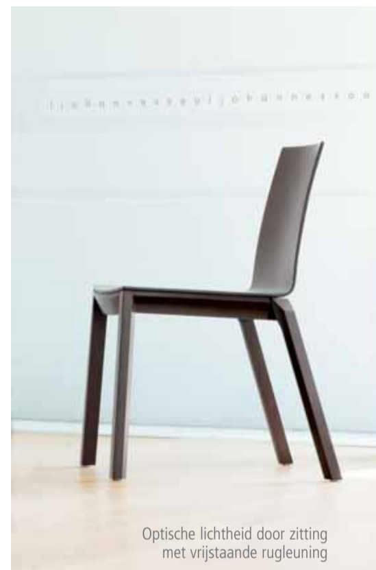
Optische lichtheid door zitting met vrijstaande rugleuning