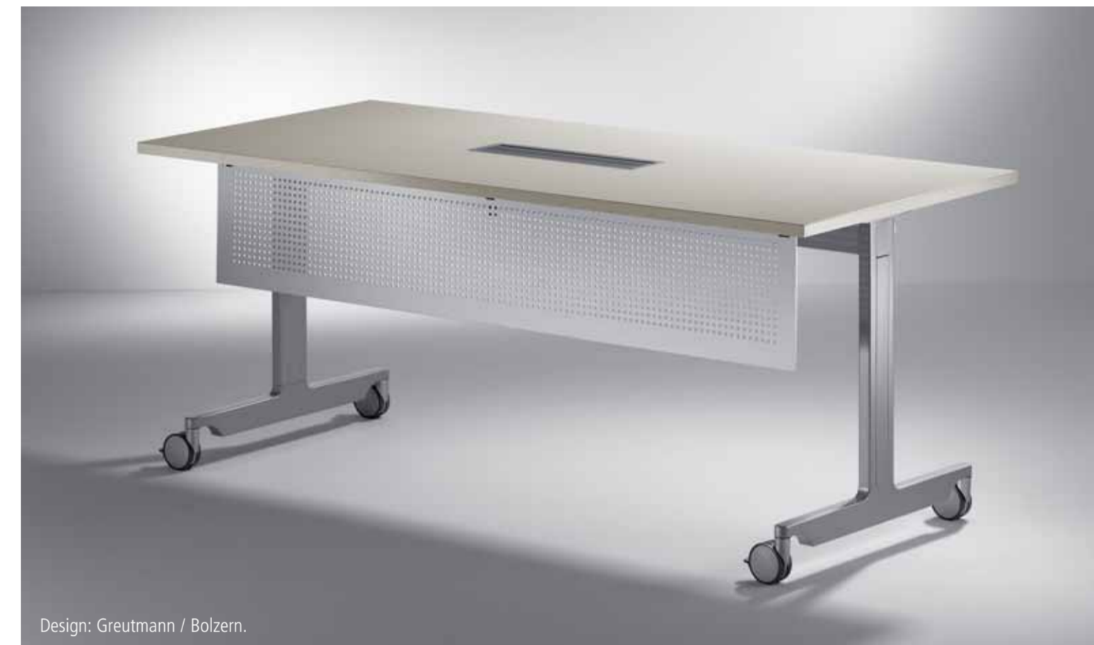
Design: Greutmann / Bolzern.

Zo kunnen tijdelijk overbodige tafels op een plaatsbesparende manier worden "geparkeerd". Het gasveermechanisme zorgt ervoor dat het blad soepel en geleidelijk kantelt. Bovendien kunnen dankzij de